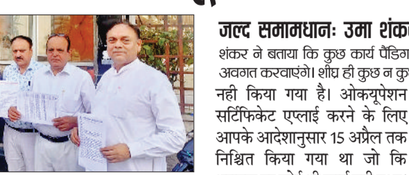
राई। एसोसिएशन के पदाधिकारी अपनी समस्याओं के समाधान को लेकर एसपिनिया कार्यालय में पहुंचे हुए।

टीडीआई एसपिनिया वेलफेयर एसो के पदाधिकारियों ने समस्याओं को लेकर समाधान न होने पर कार्यालय में जाकर समाधान का मांग पत्र देते समाधान न होने पर भूख हड़ताल व धरने पर बैठने के लिए अवगत करवाया। उन्होंने मुख्यमंत्री, जिला नगर योजनाकार, डीसीपी सोनीपत, बहलागढ़ थाना प्रभारी से मांग की कि मामले में संज्ञान लेकर हमारी मदद करें अगर समाधान नहीं हुआ तो 28 अप्रैल के बाद भूख हड़ताल व धरने पर बैठने को मजबूर होंगे।