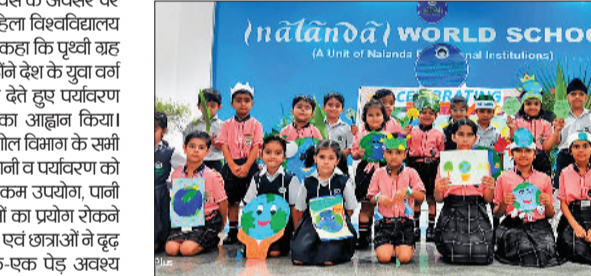
प्रस्तुति देते हुए नालंदा वर्ल्ड स्कूल के बच्चे।