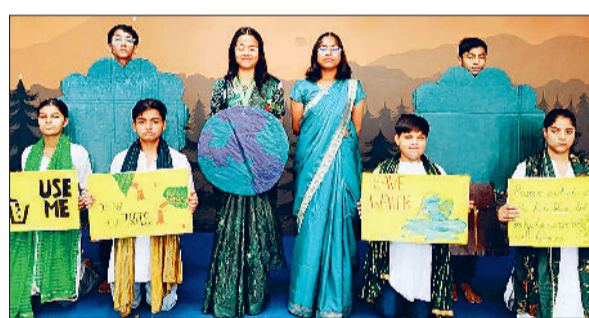
गन्नौर। प्रतिभागी छात्र अपने द्वारा बनाए गए पोस्टर व बैनर दिखाते हुए।