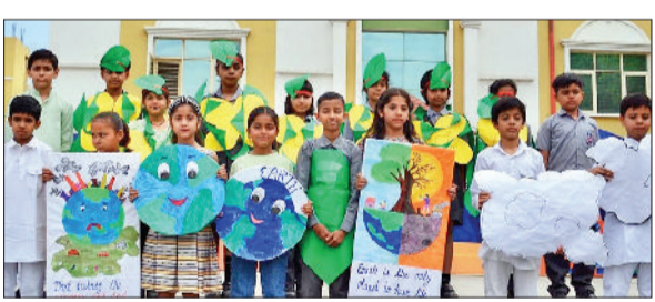
गन्नौर। छात्र पृथ्वी पर आयोजित कार्यक्रम में हरे रंग की पोशाक पहने हुए।

हैपी चाइल्ड इंटरनेशनल स्कूल में पृथ्वी दिवस बहुत धूमधाम से मनाया गया। विद्यार्थियों ने भाषण व कविता के माध्यम से सभी लोगों को संदेश दिया कि पृथ्वी दिवस केवल एक दिन मनाने का विषय नहीं है पृथ्वी की सुरक्षा हमारी सुरक्षा है। विद्यार्थियों ने हरे रंग की पोशाक पहनकर एक एक प्रस्तुत किया। जिसमें पेड़ पौधों के महत्व को दर्शाया कि हरे भरे पेड़ पौधों से ही मनुष्य के साथ-साथ सभी जीव