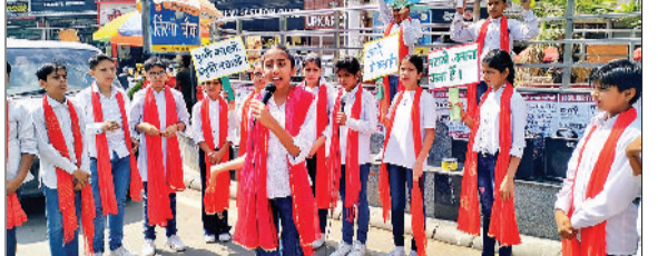
सोनीपत। शहर के चौक पर जागरूकता कार्यक्रम के दौरान मौजूद छात्र-छात्राएं।