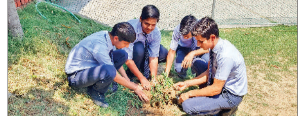
सोनीपत। पौधारोपण करते हुए छात्र।